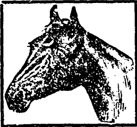
Marque de Fabrique