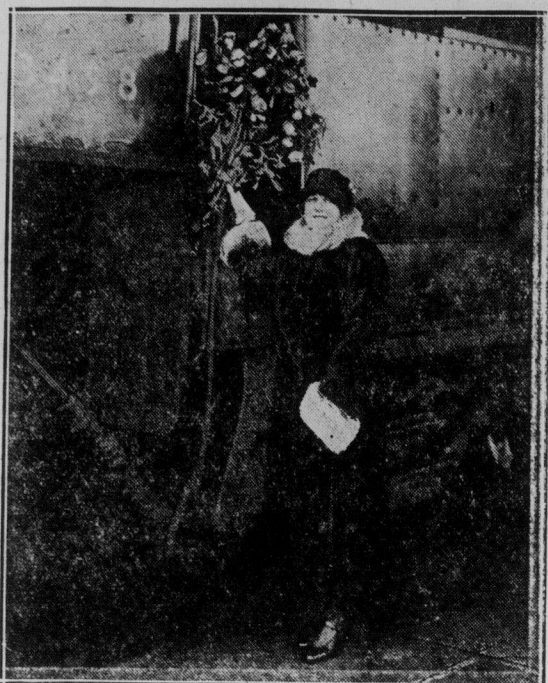
Madame Jeritz, présente un superbe bouquet aux mécanicien et chauffeur du train, à son départ de la gare Windsor pour Toronto.

Madame Maria Jeritz, l'éminente soprano viennoise que la métropole avait déjà eu la bonne fortune d'entendre au dernier, est revenue se faire applaudir par les Montréalais en un superbe concert qui eut lieu au Forum le 8 octobre et auquel assistaient plus de 4,000 personnes.