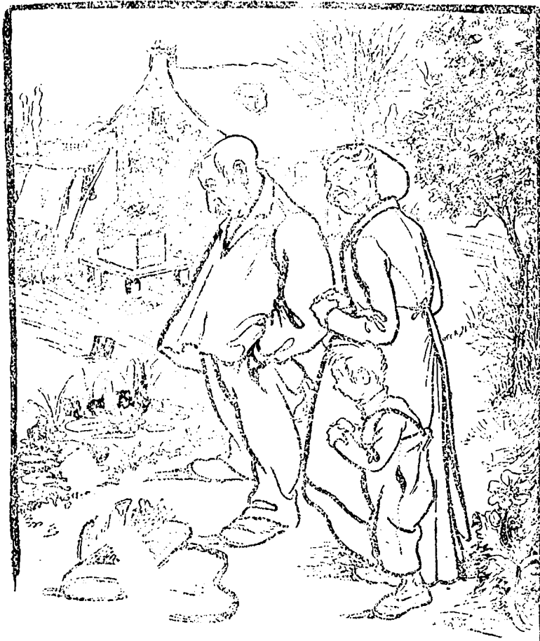
(En voulant rompre le fleur de néphrolep, M. Francheteau tombe à l'eau.) Le poisson. Il doit être à la recherche d'une plante bien rare, car voilà un bon quart d'heure qu'il est sous l'eau...