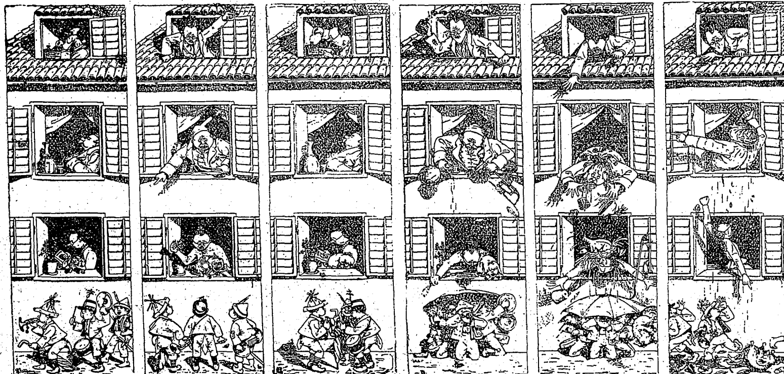
La marche des ennemis.