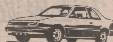
Sundance S 三門自動波 只售 $9,998