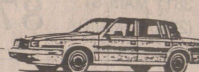
New Yorker Fifth Avenue 只售 LOADES 設備齊全 $25,995