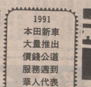
CAMUS LAU 劉冠星 傳呼：645-4516