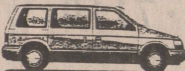
自動波 Voyager 只售 V. 6, 7個座位 $16,995