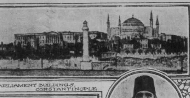
PARLIAMENT BUILDINGS, CONSTANTINOPLE.