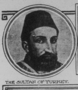
THE SULTAN OF TURKEY.