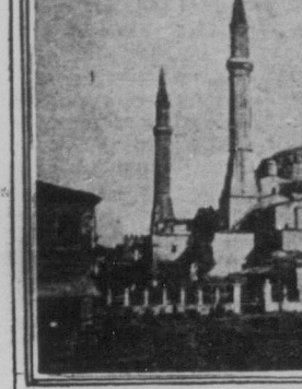
SULTANEN, SOFIA-MOSKEN OCH PARLAMENTSBYGGNADERN I KONSTANTINOPOL.

Som vi förliden vecka helt hastigt omnämde utbröt i tisdags i v. en revolution i Konstantinopel. Denna var satt i scen af de reaktionära elementen i Konstantinopel som mål. I går, tisdags, telegraferades att Konstantinopel var omringad af ungturkiska truppdelningar, hvilka ledare bestämt sig för att afdaga sultanen, hvilken genom sin trohet förverkat lifvet. Det lär nu vara bevisadt, att det var han som understödt revolutionen. Han lär nu hafva flytt från sin huvudstad. Detta meddelades i går, tisdags. I dag på morgonen, onsdag, gifva telegrammen från Konstantinopel vid handen, att Abdi Hamid håller på att under-