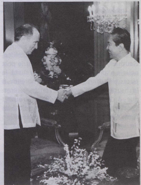
Le président Marcos des Philippines recevant M. Trudeau.

Le premier ministre Trudeau a terminé son voyage par une visite au Japon, deuxième partenaire économique du