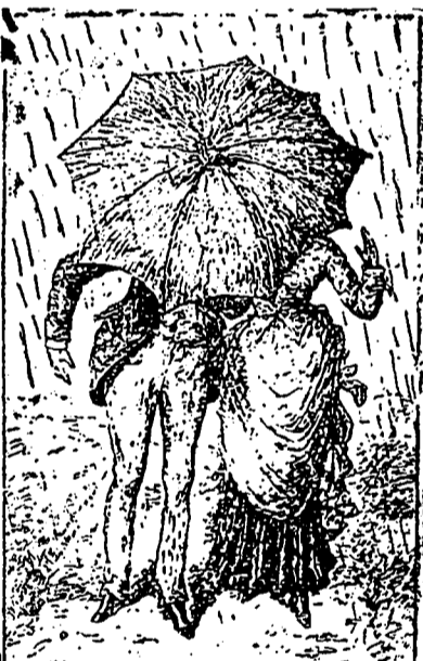
Ce que l'on voit depuis avril