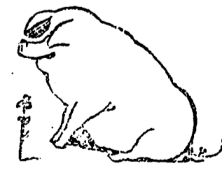
Chic! Ah! go!

PASSEPARTOUT PUBLIÉ PAR ROUILLIARD & CIE. Editeurs-Propriétaires BLOC-BRUNSWICK SOREL.