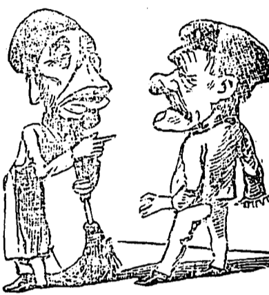
Balayeurs de la rue St Jacques