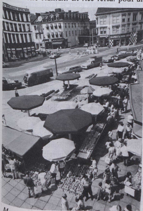
Marché d'Hamilton (Ontario).

Extrait du Bulletin de la Banque royale du Canada, juin 1979.