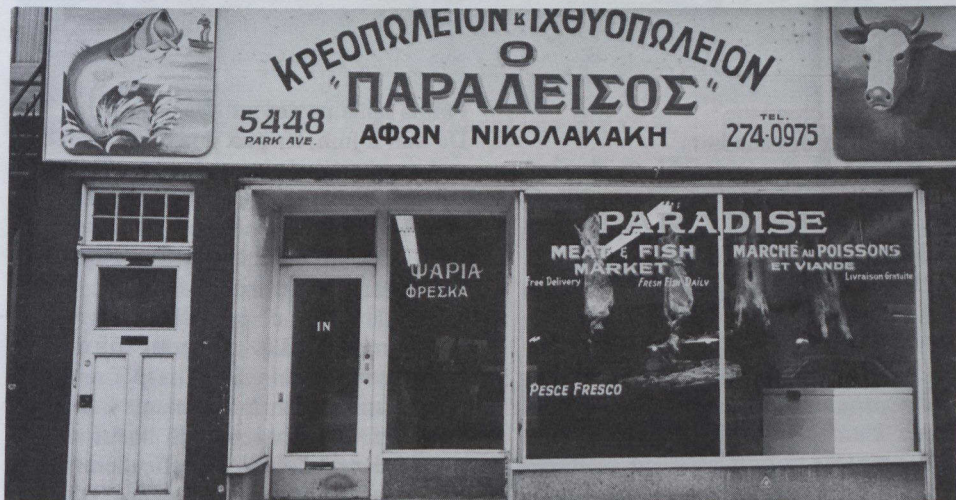
Une boucherie de Montréal aux inscriptions trilingues.

neuves ne peut manquer de réserver des surprises à quiconque considère l'histoire comme synonyme d'ancienneté. L'excellent musée de l'Alberta à Edmonton, par exemple, fournit la preuve que l'histoire n'en pique pas moins la curiosité parce qu'elle est relativement récente. Une exposition de machines agricoles datant de la fin du siècle passé peut s'y révéler aussi intéressante qu'un étalage d'armures de guerre dans une ville ancienne de l'Europe. Edmonton possède huit autres musées, y compris l'énorme Fort Edmonton.