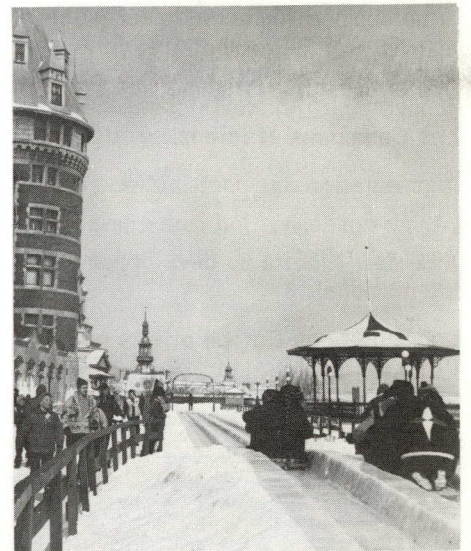
La glissade près du Château Frontenac est l'une des attractions d'hiver de la vieille Capitale. On y descend sur une distance de 300 pieds à plus de 60 milles à l'heure.

Avec le temps, de nouvelles attractions s'ajoutèrent à celles du début. Depuis quelques années, par exemple, on installe sur une place publique, une