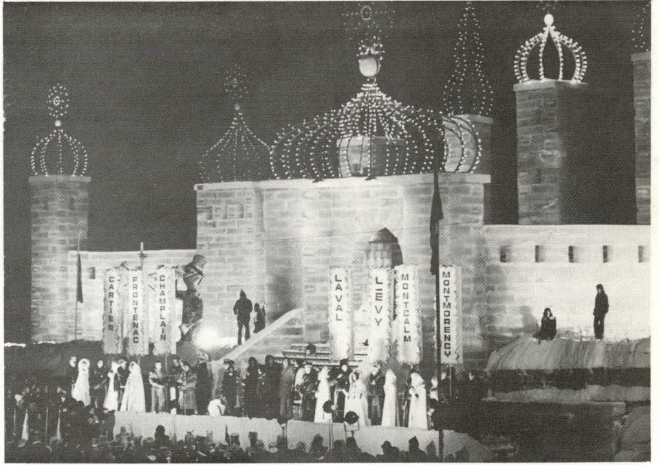
Le Palais de glace où seront enfermés ceux qui ne veulent pas s'amuser...

siastes s'entassent de chaque côté du fleuve pour regarder les équipes, à bord de canots fabriqués spécialement pour la circonstance, lutter contre la marée et le courant et, de temps à autre, soulever leur embarcation et la traîner au-dessus des bancs de glace pour la plonger à nouveau dans les eaux glacées.