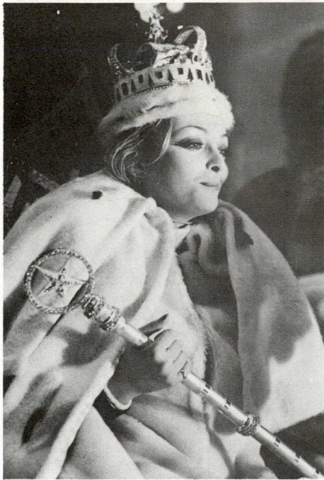
La Reine du Carnaval