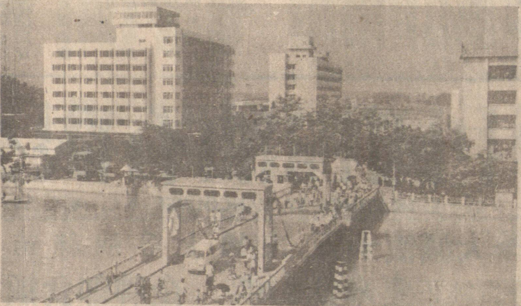
廣東中山縣石岐鎮