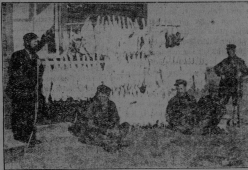
Eine Hasenjagd bei Rosfeld in 1903.

sehen Jeffries und Johnson in Reno zeigen, wurde von Beamten der berittenen Nordwest-Polizei das Zeigen der Bilder verboten und die Abzüge konfisziert. Die Polizei handelte im Auftrage des Generalstaatsanwalts Turgeon. Die Besitzer des betreffenden Theaters resp. der Bilder sind unter der Anklage vor Gericht geladen worden, unzüchtige und unmoralische Schaustellungen veranlassen zu haben. So wenig ansprechend auch so ein brutaler Faustkampf sein mag, so gibt es doch noch ganz andere Schaustellungen, die weit ungünstiger und unmoralischer sind, ohne daß sie verboten werden.