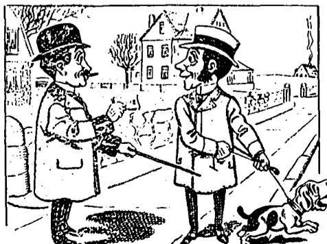
IV ... Bonjour, voisin. Quel beau chien vous avez. En voulez-vous vingt piastres ?