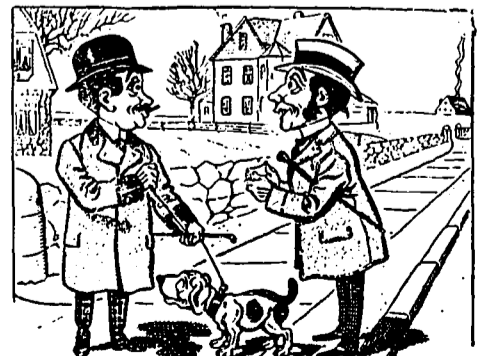
V Le voisin. — De suite. Il n'y a rien que je ne puisse faire pour vous.