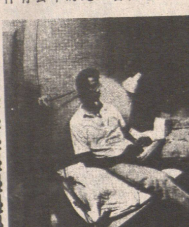
「監獄鏡報」的編輯工作，是由一名前在監獄中執行職務的獄警負責的。

「監獄鏡報」的編輯工作，是由一名前在監獄中執行職務的獄警負責的。他因在監獄中，由於刊登了一些關於獄警的報導，亦惹得獄警不滿，除以其權力對付這名獄警中，後來監獄當局只得把他開除。由於這名獄警，再不能把這名獄警再作新聞消息刊登。