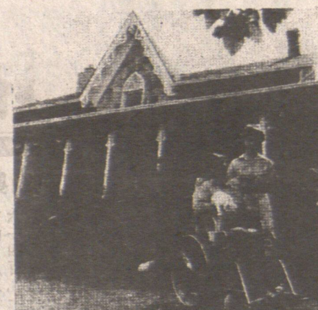
「監獄鏡報」的編輯工作，是由一名前在監獄中執行職務的獄警負責的。