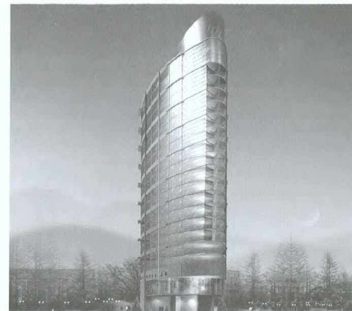
Le Jiangjin Hotel, réalisation de la firme Nicolson Tamaki Architects de Vancouver

La petite taille de nombreuses firmes canadiennes pose une autre difficulté. Si une petite entreprise offre plus de souplesse,