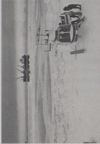
砕氷船から北方の村に物資を運ぶソリつきヘリコプター。

そのため、当局では毎冬、車を運転する人たちに、アイス・スクレーパー（氷をかき落とす）やスノーブラッシュ（雪を払い落とす）といった常備品はもちろん、防寒具、電灯および点滅灯、救急箱、牽引用のチェーンやロープ、タイヤ・チェーン、乾いた砂、バッテリー用のジャンパー線を必ず携帯するよう、呼びかけ