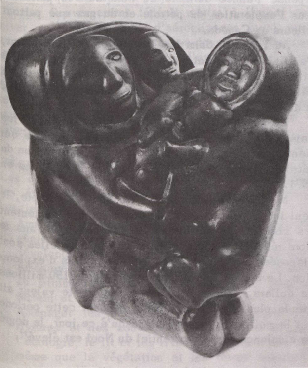
Ci-dessus — Statuette en néphrite (1968-1969) par Kenojuak, du cap Dorset, représentant une famille esquimaude et un chiot.

Une importante exposition d'art esquimau, présentée sous le patronage du Gouvernement canadien, s'est ouverte le 29 juin à Leningrad, en Russie, au célèbre musée de l'Hermitage. Intitulée La sculpture chez les Inuit: chefs-d'oeuvre de l'art canadien , cette exposition de plus de 400 pièces constitue un panorama des différentes cultures qui se sont succédé dans l'Arctique canadien au cours des âges. Elle comprend aussi de nombreuses oeuvres contemporaines.