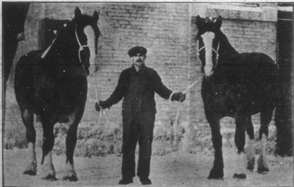
Glen és Chief, a Manitoba Cartage szállítási vállalat két gyönyörű Percheron telivére, melyek első díjat nyertek a legutóbbi chicagói állatkiállításon. (A "Southam Press" szíveségéből)

— Hah hűtlen kigyó, állj csak a csabító mög! Egy lö- véssel akarok végezni veletek.