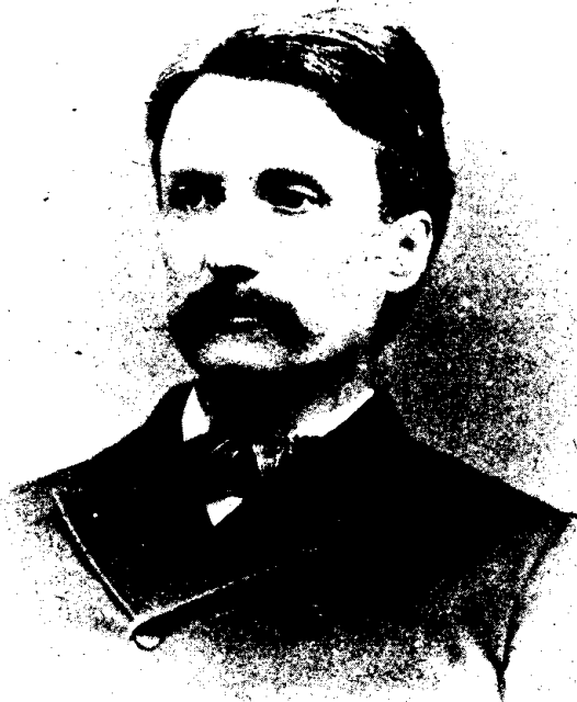
M. O.-M. AUGÉ, C.R.

La ligne, par insertion . . . . . 10 cent Insertions subséquentes . . . . . 5 cent Tarif spécial pour annonces à long terme