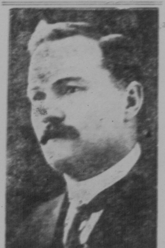
F. A. Darke, Regina, legt sein Mandat nieder.

Regina. — Eine Rede, die für die Erneuerung der liberalen Bewegung in Saskatchewan eine große Bedeutung hat, wird heute in Regina gehalten werden. Die Rede wird von dem ehemaligen Premierminister von Saskatchewan, F. A. Darke, gehalten werden. Darke wird seine Mandate niederlegen und an die Stelle von Premierminister Dunning treten. Die Rede wird am Donnerstag in Regina gehalten werden.