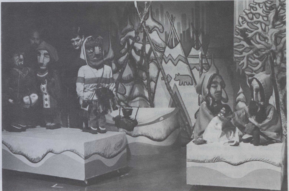
Une scène de Nico et Niski et l'étoile de Noël montée par le Cercle Molière.

Aussi à l'aise en anglais qu'en français,