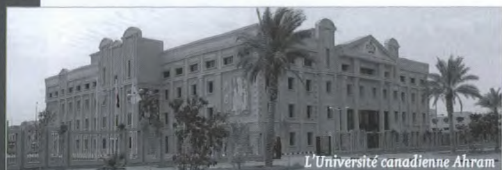
L'Université canadienne Ahrām

En Égypte, la famille moyenne consacre environ 40 % de son revenu à l'éducation, et le pays se classe bon premier au Moyen-Orient en ce qui a trait au nombre d'étudiants. Il n'est donc pas étonnant que le marché égyptien des services éducatifs offre d'énormes possibilités aux fournisseurs canadiens.