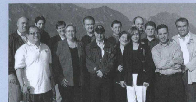
La délégation de fabricants canadiens au Mexique.

produits à l'occasion de colloques techniques organisés à l'intention des constructeurs et des architectes; a visité des chantiers de construction de bâtiments de faible et de grande hauteur; et a participé à Expo CIHAC 2005, la plus grande foire de la construction en Amérique latine.