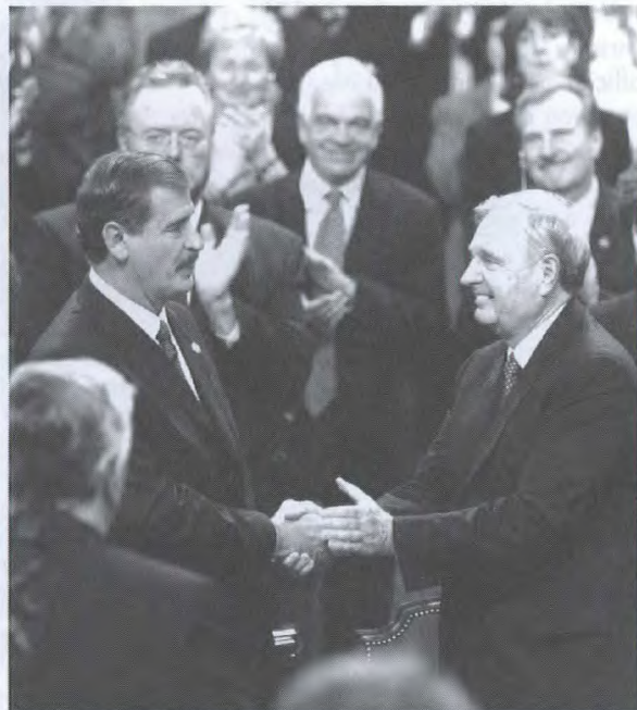
Le 25 octobre 2004 : Le premier ministre Paul Martin et le président du Mexique Vicente Fox prononcent un discours devant le Parlement.

Le président Fox a également rencontré des gens d'affaires du Canada et du Mexique lors de voir page 2 — Président mexicain