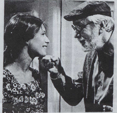
Jean Duceppe dans Terre humaine .

Betty Oliphant est née à Londres. Après avoir étudié le ballet auprès de professeurs renommés, notamment Tamara Karsavina et Laurent Novikoff, elle a