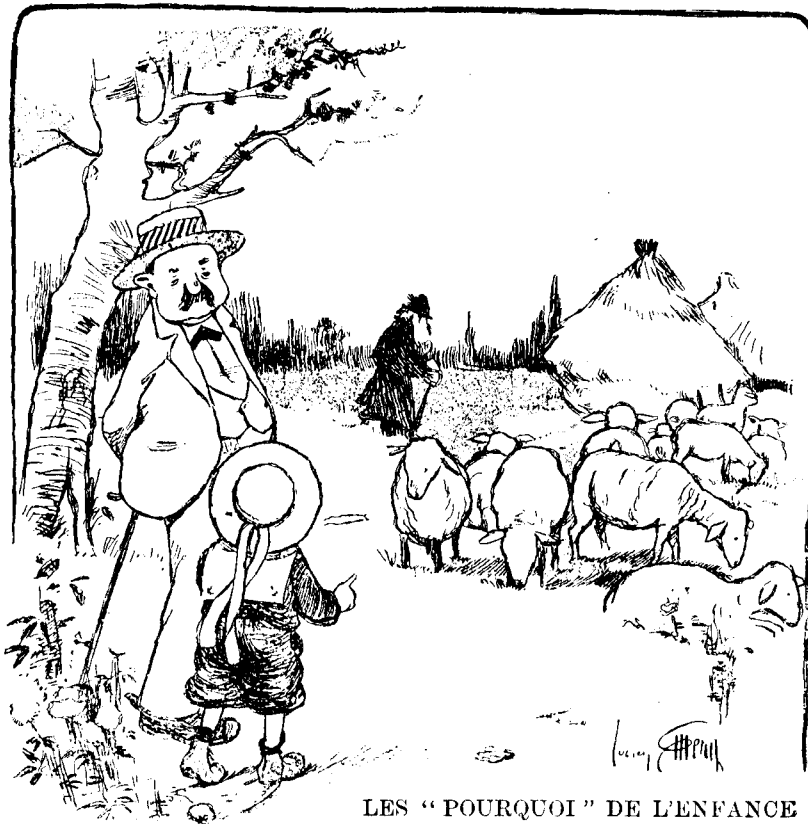
LES "POURQUOI" DE L'ENFANCE

Lui. — Pourvu, mon Dieu, que les Durand soient sortis ? Elle. — Cependant, s'ils y sont, nous serons bien obligés de monter. Lui. — Oai, mais tu sais... Juste le temps de leur dire combien nous sommes heureux de les trouver chez eux, et nous filons.