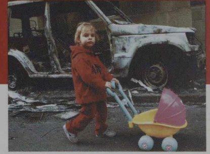
Une fillette pousse une voiturette devant les restes d'un véhicule de police incendié devant le Parlement yougoslave à Belgrade, le 7 octobre 2000.