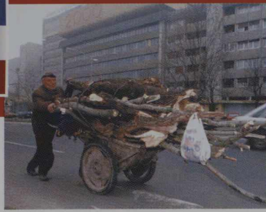
Un homme roule un chariot rempli de bois de chauffage dans les rues de Novi Sad, la capitale de la province yougoslave de Voïvodine, à 80 km au nord-ouest de Belgrade, le 11 janvier 2000.

Parmi les problèmes immédiats, figurent des pénuries possibles sur les plans du chauffage et de l'électricité cet hiver, et la nécessité d'aider des centaines de milliers de réfugiés et de personnes déplacées à l'intérieur du pays à rentrer chez eux. À plus long terme, la RFY aura besoin d'aide pour se transformer en une économie de marché et se doter d'institutions démocratiques solides.