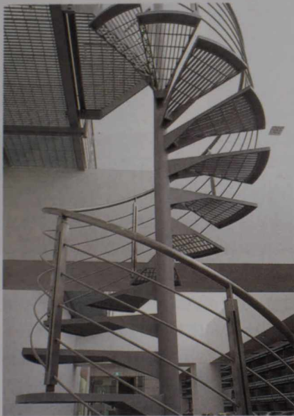
リサーチ・ライブラリー(地下2階)の螺旋階段。