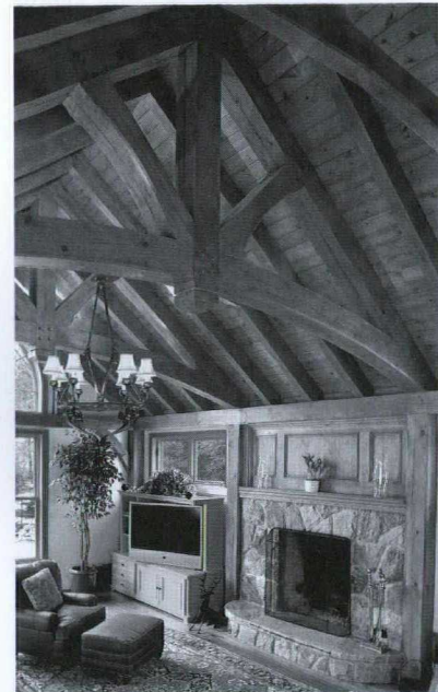
Maison à charpente en bois de Normerica.

Normerica a été mise en contact avec Great Falls Construction, un constructeur américain de maisons sur demande, lors d'une