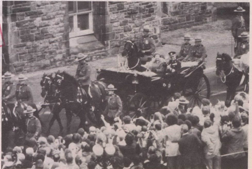
Llegada de la Reina Isabel y el Príncipe Felipe al Parlamento en Landó.