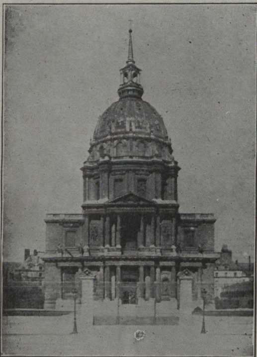
L'Hôtel des Invalides

Lutèce a connu les aqueducs dès le temps des Romains et lorsqu'elle devint l'un des postes les plus importants de la préfecture gauloise, la résidence