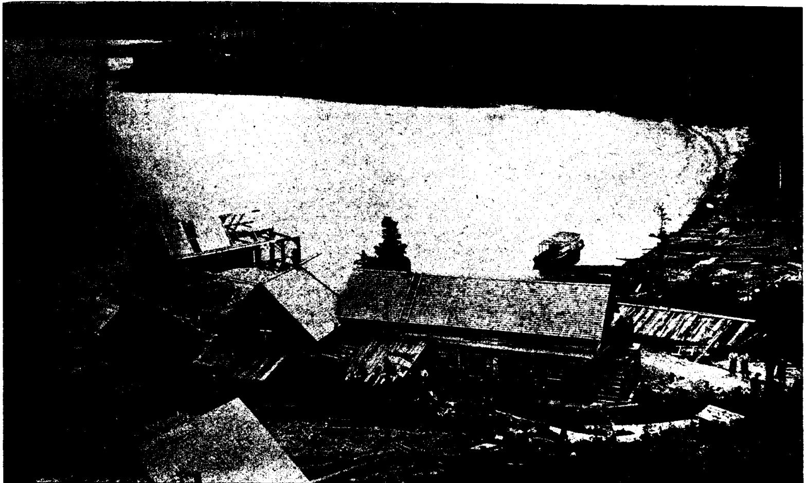
AU TEMISCAMINGUE : CANTON DUHAMEL.—Les mines d'argent.