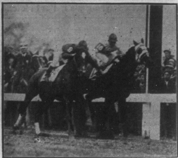
Az elmúlt héten futották le Angliában a tavaszi lóversenyek legérdekesebbikét. A versenynek különös érdekességet ad az, hogy az egész angol birodalomban elterjedt sorsjegyek nyeresi eshetőségei ettől a versenytől függöttek.