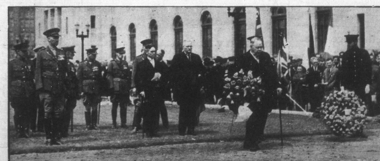
Május 28-ikán nagy pompával adóztak az elesett katonák emlékének az egész országban. Képünk azt a jelenetet ábrázolja, amikor a winniepei polgári és katonai előkelőségek megkoszorúzzák az elesett katonák emlékművét.