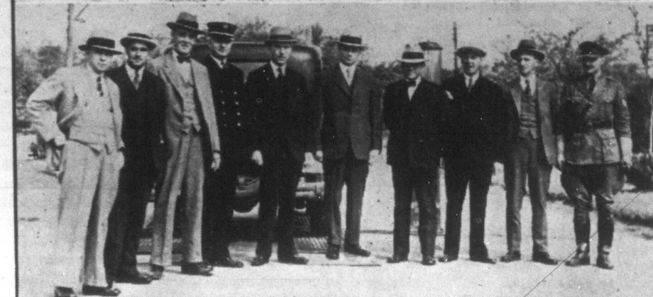
A tavaszi idő beköszöntével az autótulajdonosok legnagyobb része ismét használatba vette kocsiját és ezrenként lépik el az uccákat. A közlekedési hatóságok mindent elkövetnek, hogy a forgalmi szerencsétlenségek elejét vegyék és ezért úgynevezett "biztonsági" hetet rendeztek országsszerte, amikor állami szakemberek díjtalanul megvizsgálják az autók fékjét. Képünk a winniepei fékvizsgáló állomás megnyitását mutatja be, a rendőrség és a tűzoltóság képviselői jelenlétében.