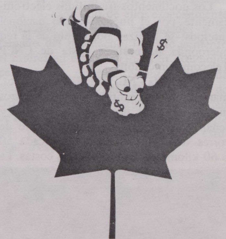
"No lo traiga"

El gobierno federal ha comenzado un programa público de información a los turistas canadienses sobre los peligros de traer consigo productos agrícolas a Canadá. El programa, cuyo título es "No lo traiga", hace énfasis en muchas plagas y enfermedades vegetales y animales mundiales que llegan a Canadá "a espaldas" de productos agrícolas tales como plantas, semillas y productos cárnicos. Estas plagas y enfermedades dejan detrás sus enemigos naturales y, como consecuencia, causan más daño en Canadá que en sus países de origen, según manifestó Agricultura Canadá que está preparando esta campaña.