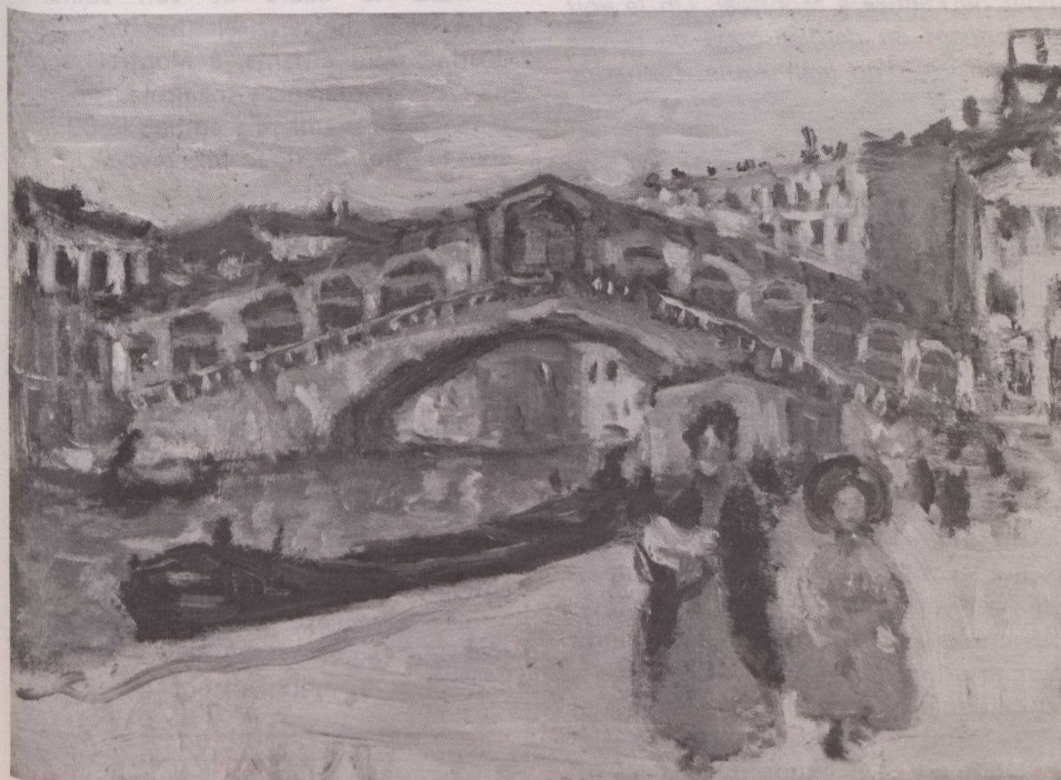
Pont du Rialto, Venise, James W. Morrice, huile sur panneau de bois, vers 1896-1906.