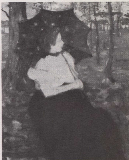
Le Parapluie bleu, James Wilson Morrice, huile sur toile, vers 1907-1909.