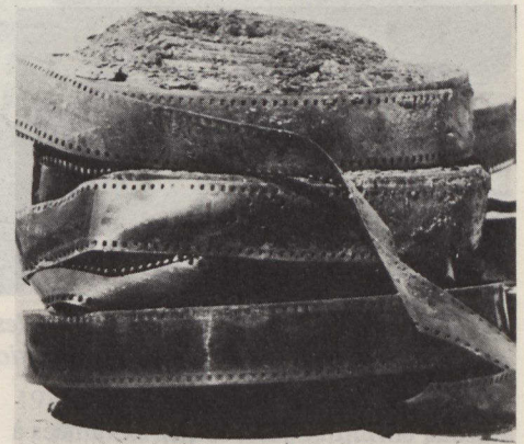
Quelques-uns des films exhumés récemment à Dawson (Yukon).

complet de la production cinématographique des années 1903 (date de réalisation du plus ancien film exhumé) à 1929. On a en effet découvert des longs métrages, des séries et des films d'actualité qui auraient composé le programme typique d'une soirée de cinéma au temps du muet.