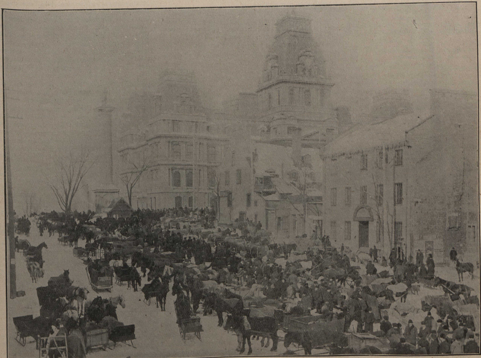
CANADA. — Vue pittoresque de la place Bonsecours, de Montréal, un jour d'hiver et de marché. A droite, au fond, l'Hôtel-de-Ville, à gauche, la colonne de Nelson.