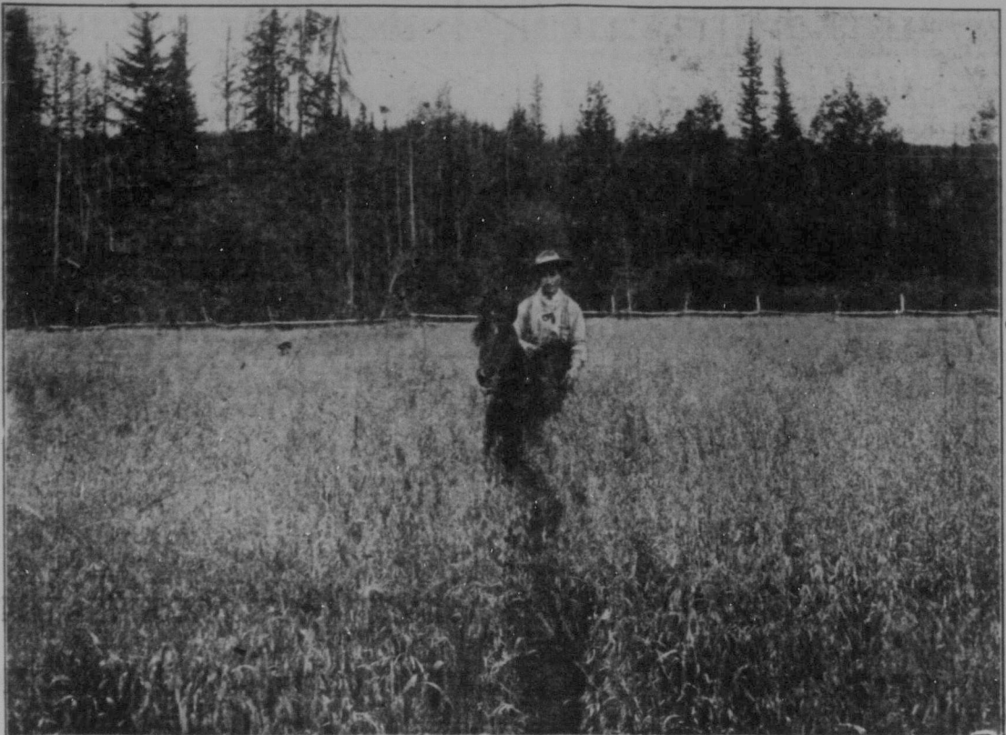
ett mäktigt vete fält i Västern.

Vetepoolerna representera den största utvecklingen av Västra Canadas familj. I var och en av provinserna Manitoba, Saskatchewan och Alberta finnes en vetepool, och dessa tre provinsiella organisationer upprätthålla en central försäljningsagentur, känd som The Canadian Wheat Pool, vilken nu är den största affärsorganisationen i Canada. Dessa vetepooler kontrollera mer än femtio procent av den canadensiska veteskörden och representera mer än 140,000 producerers förenade arbete. Nära 1,700 pool-elevatorer avtecknas mot präriehorison och elva väldiga terminaler mottaga poolens vete vid Stilla Havskusten och vid De Stora Sjöarna. Den centrala försäljningsagenturen upprätthåller permanenta kontor i London, Paris och Buenos Aires tillika med viktiga filialkontor i städer i Canada och Förenta Staterna.