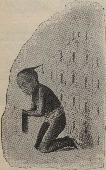
Ecolier hindou en pénitence.

Il y a un service postal mensuel à travers le Sahara.