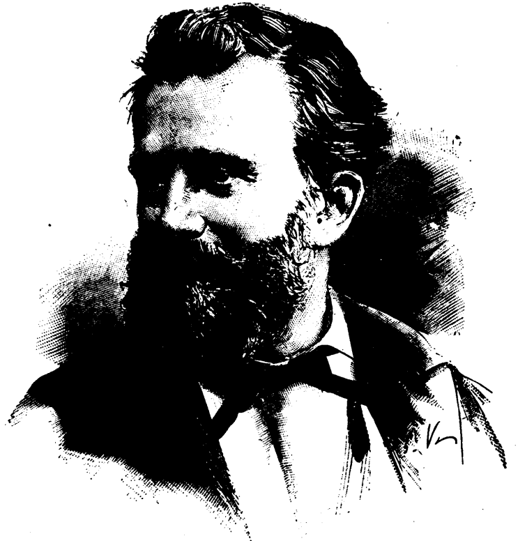
M. DE LANESSAN, GOUVERNEUR GÉNÉRAL DE L'INDO CHINE