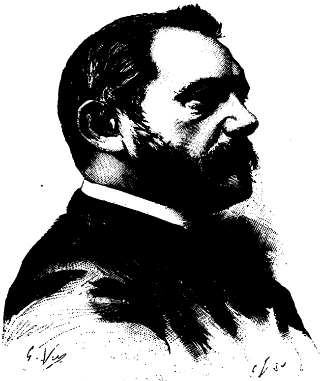
M. CAMBON, GOUVERNEUR GÉNÉRAL DE L'ALGÉRIE