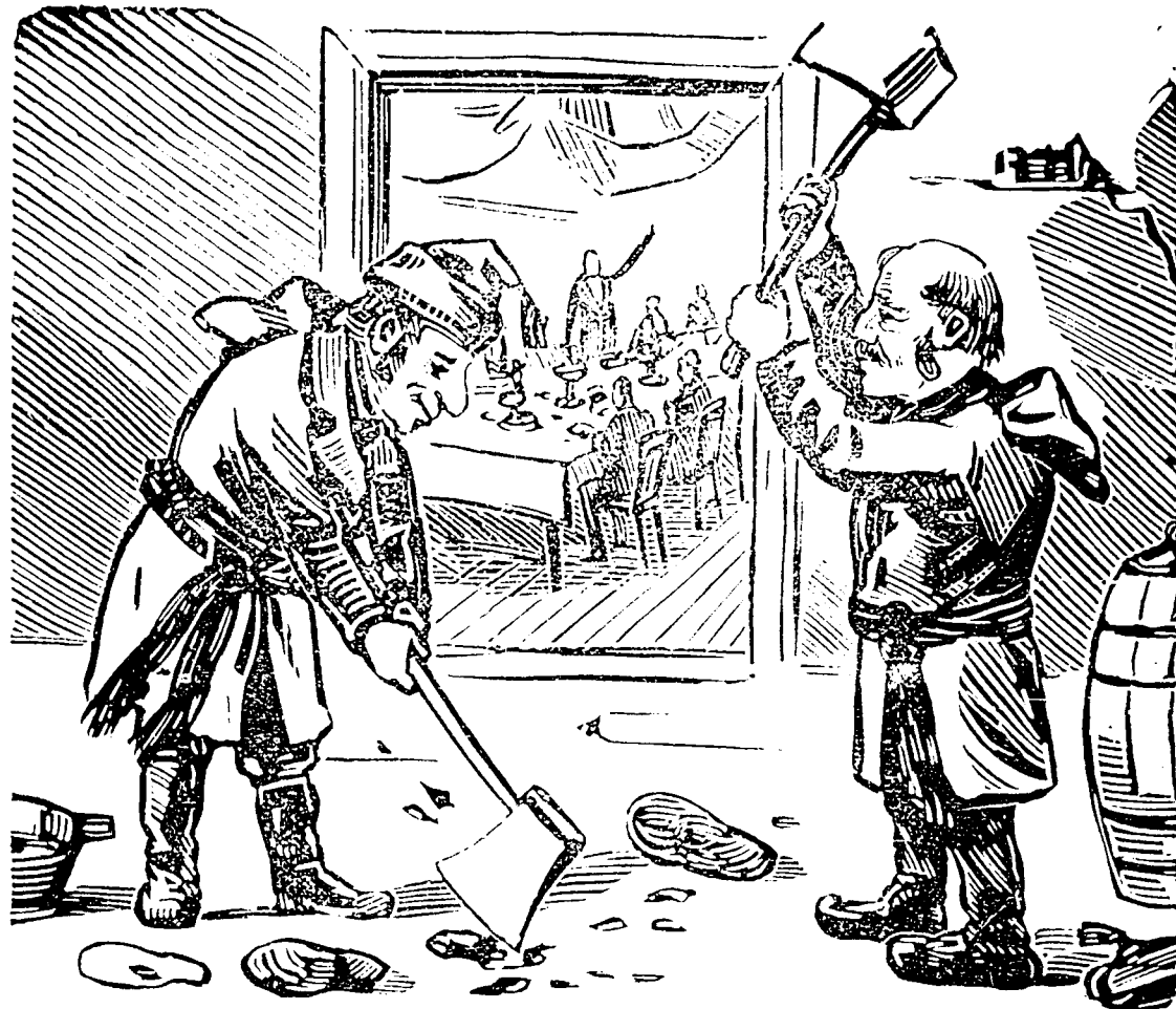
Pendant la fête du curé Labelle, à St. Jérôme, les colons du Nord, qui n'ont pas de couteaux, ouvrent les huîtres d'après un nouveau système.

Quai de la Compagnie du Richelieu et d'Ontario.