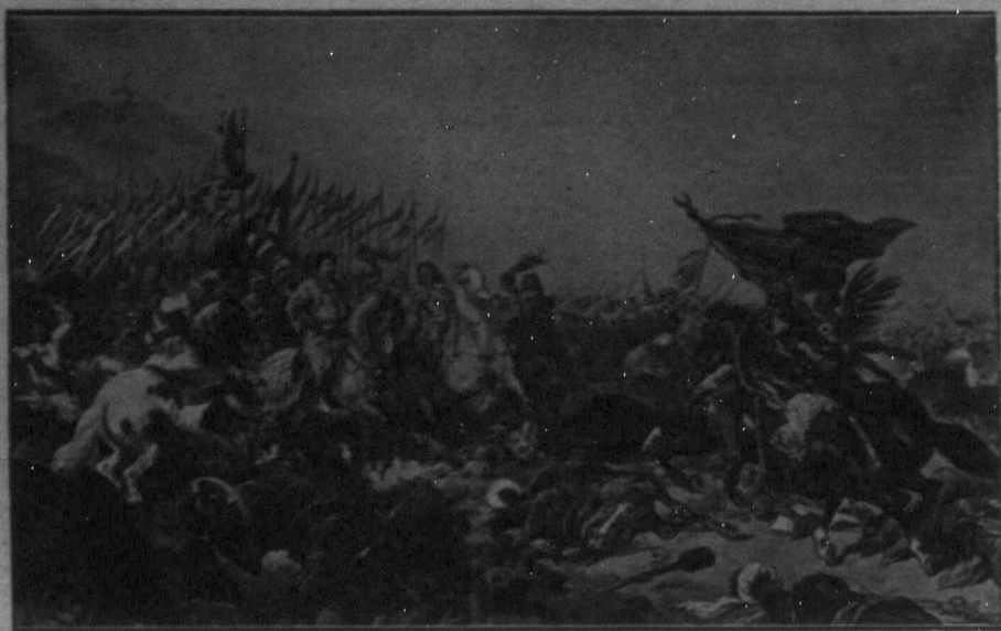
Sobieski Jánost, a Magyarországot török iga alól felmentő lengyel királyt ábrázolja csapatai élén fenti képünk, melynek eredetijét a vatikáni múzeumban őrzik.