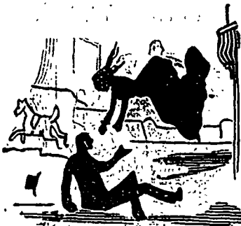
Celle-ci, décidée à suivre partout son mari, n'hésite pas à le rejoindre.