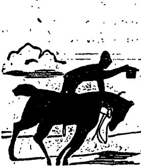
Et met toute sa grâce à batifoler devant celle qu'il adore.