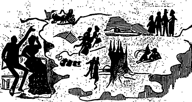
Il lui fait la description du bonheur du ménage — et lui jure de l'aimer toujours....