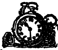
L'heure de Jérusalem.

Notre photographe spécial a pris un négatif de chronomètre du Revd. M. Piché, au moment même où elle marquait l'heure de Jérusalem. Voici une copie de cette photographie.