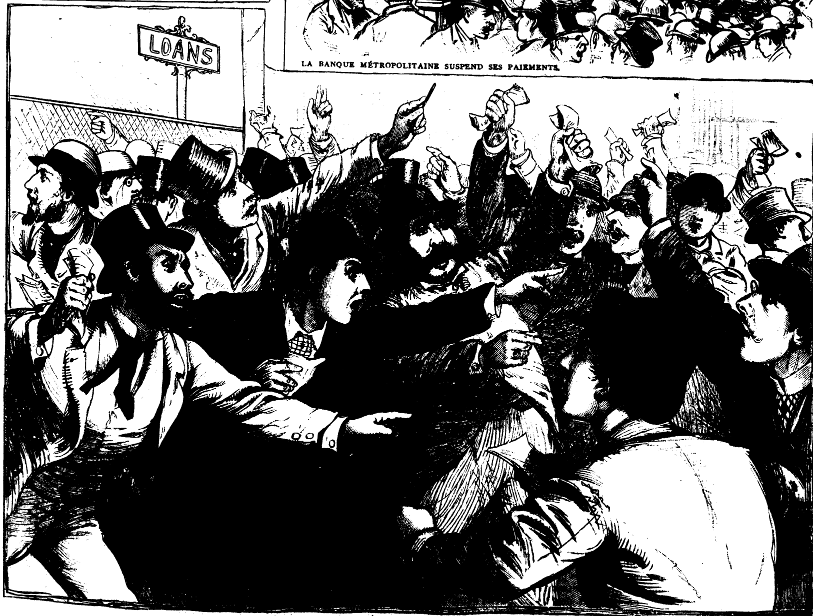
NEW-YORK—LE RÉCENT DÉSASTRE FINANCIER: SCÈNE DE BOURSE.