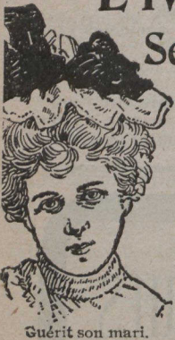
Guerit son mari.

Echantillon Gratuit et circulaire contenant détails, témoignages, et prix, envoyés dans une enveloppe cachetée. Correspondance religieusement confidentielle. Incluez un timbre pour la réponse. Adressez: The Samaria Remedy Co., 23 Jordan St., Toronto, Can.