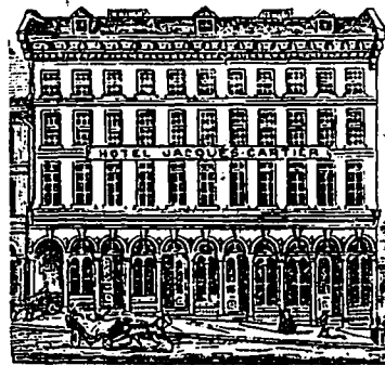
Place Jacques-Cartier MONTREAL