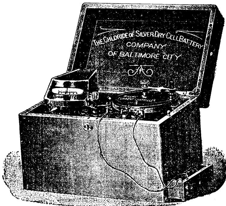
Type d'appareil à courant continu de 25 à 50 éléments avec rhéostat et milliampère-mètre.

Catalogue complet d'appareils, électrodes et accessoires envoyés sur demande.