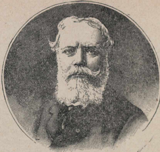
Alexandre Cabanel, d'après une photographie.