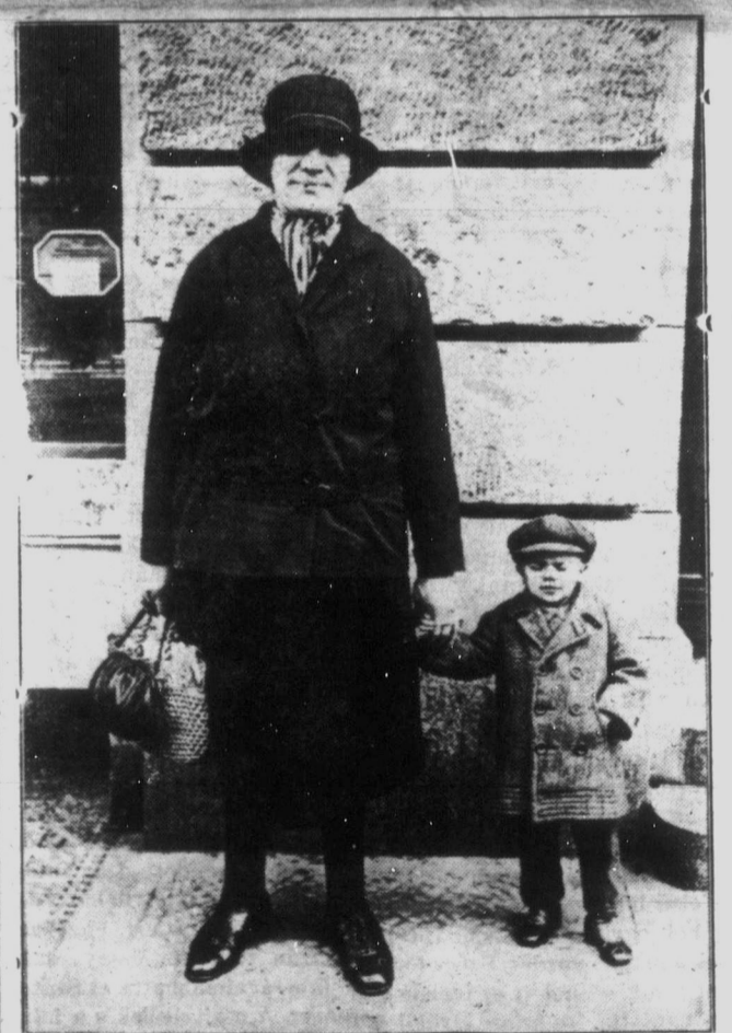
A világ — kétségkívül — legérdekesebb házaspára látogatta meg a héten Nyugatkanadát. Ime: bemutatjuk a feleséget és „férjurasmat”, akinek igazán nem jelszava, hogy „az asszony verve jó!” Azt mondják, ha férjuras elfárad, felesége az ölébe veszi a úgy viszi tovább.